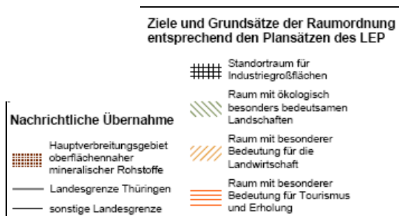
Abbildung 2: Freiraumstruktur (Ausschnitt LEP 2004, Karte 2)