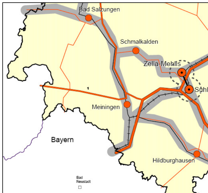
Abbildung 1: Raumstruktur und Funktionales Verkehrsnetz (Ausschnitt LEP 2004, Karte 1)